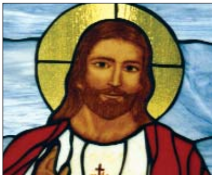
Migrația ilegală în spațiul UE crează tensiuni și în spațiul religios