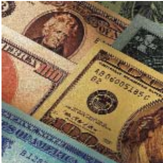
Sănătatea face economii prin intermediul site-ului www.e-licitatie.ro

Cele mai mari economii realizate de instituții din subordinea Ministerului Sănătății prin www.e-licitatie.ro au fost înregistrate în București, județele Vâlcea și Mureș, atingând 193,56, 102,41, respectiv 53 miliarde lei față de bugetul inițial. Valoarea totală a licitațiilor închise de către instituțiile din subordinea MS din toate județele țării se ridică la 3627,81 mili-