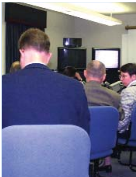
ANRC a modificat și completat Regimul de Autorizare Generală în urma publicării legii serviciului universal.

În cadrul reuniunii a fost supus dezbaterii un set de proiecte pentru care s-a încheiat deja procesul de consultare publică. La această întrunire au participat reprezentanții ANRC alături de reprezentanți ai industriei de comunicații electronice și ai altor organizații interesate de prevederile proiectelor discutate. Pe agenda reuniunii s-au aflat următoarele documente: Proiectul de decizie privind modificarea și completarea Deciziei Președintelui ANRC nr.139/2002 privind stabilirea procedurii de soluționare a litigiilor ce intră în competența ANRC, Proiectul de decizie privind regimul de autorizare generală pentru furnizarea rețelelor și a serviciilor de comunicații electronice, completarea Proiectului de decizie privind raportarea unor date statistice de către furnizorii de rețele și servicii de comunicații electronice, Proiectul de decizie privind procedura de acordare a dreptului de utilizare a codurilor punctelor de semnalizare naționale și internaționale, precum și Proiectul de Ghid al Consumatorului. În urma intrării în vigoare a Legii Serviciului Universal