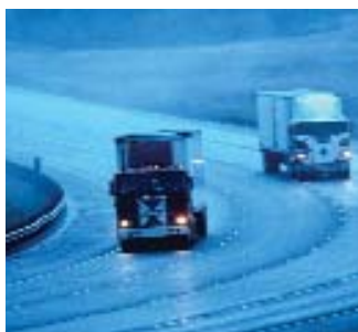
Transportatorii vor putea obține autorizații de circulație prin intermediul site-ului www.autorizatiiauto.ro

Sistemul informatic pentru atribuirea electronică a autorizațiilor de transport rutier internațional de marfă va începe să funcționeze, acesta fiind accesibil pe Internet la adresa www.autorizatiiauto.ro . Autorizațiile vor fi acordate online, iar transportatorii vor putea vedea în timp real ce și câte autorizații sunt libere, precum și dacă cererea lor a fost aprobată sau nu. Avantajați vor fi transportatorii din provincie care nu mai sunt obligați să se deplaseze la București pentru a-și ridica autorizația, aceasta putând fi trimisă de către IGCTI în plic recomandat, la sediul lor. Autorizațiile rutiere vor rămâne în continuare responsabilitatea Autorității Rutiere Române și a Ministerului Transporturilor, Ministerul Comunicațiilor având doar responsabilitatea tehnică de a menține sistemul electronic de atribuire a acestora, precizează Ministerul Comunicațiilor.