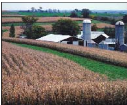
Valoarea totală aprobată pentru proiectele SAPARD se ridică la 52 milioane euro.

eligibilă de 1.319.354 euro, și construirea în Muntenii de Jos, județul Vaslui, a unui abator cu o valoare totală eligibilă de 1.994.771 euro. Pentru submăsura "Legume, fructe și cartofi", proiectul eligibil își propune modernizarea depozitului frigorific din Iași, pentru congelarea și ambalarea legumelor și fructelor, valoarea totală eligibilă a lui fiind de 1.295.117 euro. În prezent, valoarea totală aprobată pentru măsura 1.1 se ridică la 52 milioane euro (valoarea cheltuielilor publice - UE și buget național), ceea ce reprezintă 100% din alocarea financiară aferentă anului 2000.