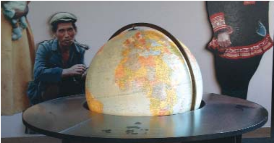
United Nations High Commissioner for Human Rights acordă granturi mici de 5000 USD pentru proiecte de combatere a rasismului