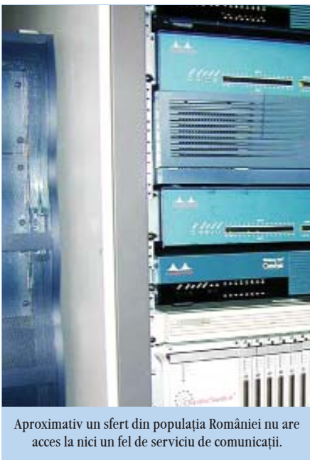
Aproximativ un sfert din populația României nu are acces la nici un fel de serviciu de comunicații.

media europeană, de peste 45%. De aceea serviciul universal este cheia