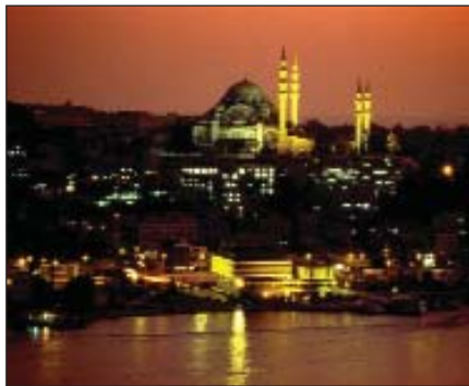
Acceptarea Turciei în Uniunea Europeană este privită cu suspiciune de către oficialii ai Uniunii Europene.

Mai mult ca oricînd, turcii doresc să devină parte a Europei. Pentru mult timp, acesta a fost obiectivul unei minorități a intelectualilor, acum însă este vorba despre o aspirație a întregii țări, apreciază Jonathan Power, editorialist al cotidianului The Jordan Times. Dacă Turcia ar fi însemnat doar Istanbulul, probabil că integrarea în Europa s-ar fi produs deja. De-a lungul secolelor, Istanbulul a fost capitala a trei imperii, a constituit locul de întîlnire dintre Est și Vest, Europa și Asia, creștinism și islamism. Dar Turcia nu este doar Istanbulul. Majoritatea turcilor locuiesc încă în orașe mai mici și în sate și pe aceștia au trebuit să-i aștepte elitele din mediul urban - nu doar din punct de vedere economic, dar și politic. Însă, în ultimele două decenii, Turcia a cunoscut o transformare la care puțini s-au așteptat. Cu șapte ani în urmă, ea se afla înaintea Greciei, țară care este membră a Uniunii Europene, și înaintea Poloniei și Ungariei, două țări care urmează să adere la forul comunitar anul viitor - din punct de vedere al puterii economice, al progreselor în domeniul științei și tehnologiei, al măsurilor adecvate luate de guvern în domeniul economic. În luna august, parlamentul a votat o lege importantă care limitează influența Armatei, ai cărei li-