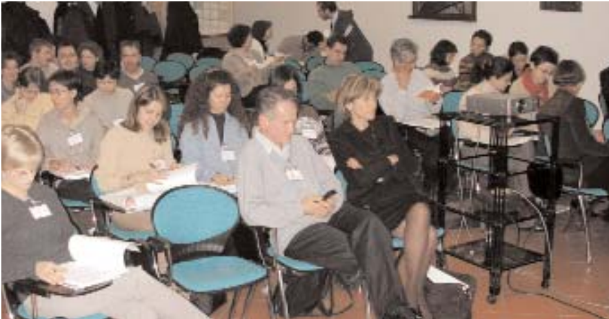
Comisia Europeană sprijină întreprinzătorii prin programul "Facilitatea de finanțare a IMM".

"Facilitatea de finanțare a IMM" este un program dedicat sprijinirii IMM din țările candidate la integrarea în UE. Programul este co-finanțat de Comisia Europeană prin Programul Phare, Banca Europeană pentru Reconstrucție și Dezvoltare (BERD) și Council of Europe Development Bank / KfW. În România, schema este activă doar prin BERD. Programul are două componente: o linie de credite și garanții, prin care se oferă credite, garanții și suport tehnic; o linie de capital, prin care se oferă fonduri de investiții pentru întreprinderi noi. În România, funcționează doar prima componentă. În vederea implementării acestei scheme de finanțare a IMM au fost semnate trei acorduri de împrumut cu bănci românești astfel: Banca Transilvania - beneficiara unei linii de credit de 10 milioane de euro; Banca Comercială Română (BCR) - beneficiara unei linii de credit de 30 milioane de euro; Alpha Bank România (ABR) - beneficiara unei linii de credit de 10 milioane de euro. Bugetul total alocat României însumează 50 milioane de euro. Solicitanți eligibili de credite sunt IMM-urile care îndeplinesc următoarele condiții: sunt persoane juridice române; sunt în proprietate privată; au cel mult 100 de angajați și o cifră de afaceri anuală de 40 milioane de euro sau un bilanț de maxim 27 milioane de euro; nu sunt implicate în activități legate de jocuri de noroc, domeniul imobiliar, operațiuni bancare, asigurări sau intermediere financiară, armament sau activități inclu-