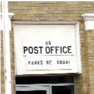
Ziua Mondială a Poștei a fost sărbătorită și în România prin seminarii în orașul Timișoara.

La data de 9 octombrie 2003 s-a sărbătorit ziua mondială a Poștei. „Cu aproape un secol și jumătate de existență, Poșta Română a fost dintotdeauna o instituție care aduce oamenii mai aproape unii de alții. Fie că, de-a lungul timpului, au fost folosite diligența, apoi telegraful și telefonul pentru ca mesajele să ajungă la destinatar, poștașii au fost dintotdeauna cei care au dus cu adevărat vestile. Poșta Română a