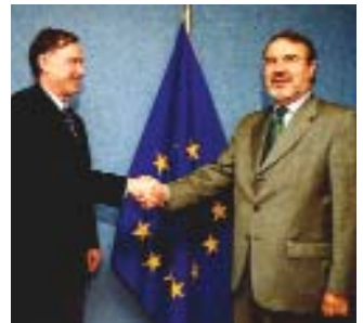
BERD acordă un împrumut de 10 milioane de euro pentru finanțarea IMM-urilor.

mijlocii. Prezentul împrumut le va permite întreprinzătorilor să achiziționeze bunuri în sistemul de leasing. De la lansarea acestei Facilități în 1999, Comisia Europeană a alocat 130 de milioane de euro pentru IMM-uri sub formă de asistență tehnică și finanțare nerambursabilă. J. Scheele, șeful Delegației Comisiei Europene în România, a declarat cu această ocazie: